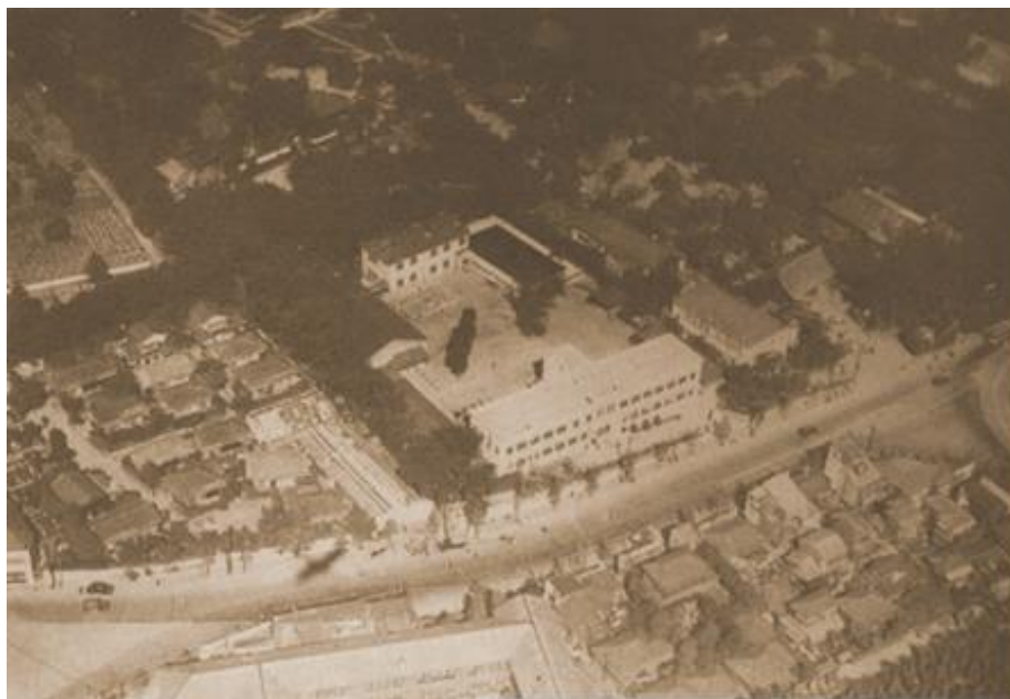
創設期の日大豊山