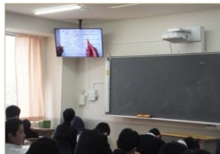
各クラス、教室のモニターで講演を聞きながらメモをとる様子