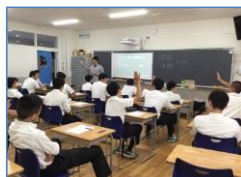
さかなプロダクション

生徒は最も興味のある2つの会社を事前に選び、各会場で講義を受けました。「身の回りにいる社会人=保護者・教員」である多くの生徒たちは、全く異なる環境で生きている講師の先生方からの話に大いに刺激を受けながら、現在取り組んでいる学習が将来にどのように結びつくのかを学ぶことができました。