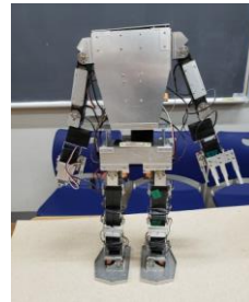
豊山のヒューマノイドロボット

11月3日(土・祝)、今年で第12回となるロボットコンテストが開催されます。これは、理工学部(精密機械工学科)が主催する高大連携教育の一環で、日大の附属校を中心に13～15校の中学・高校が参加しています。本校は第2回から第11回に参加し、第5回・第8回・第9回の計3回の総合優勝を達成しています。参加メンバーは電算部を中心とした有志ロボットチームで、今年のチームは、高校(電算部)2名、中学(数学部)16名の合計18名。中学生中心でヒューマノイドロボットとAI競技に挑みます。特に今回は、人工知能AIを作る際に利用されるラズパイ(Raspberry Pi)を使って、画像認識(犬・ネコ・人)に挑戦します。結果は、12月号の紙面で報告したいと思います。