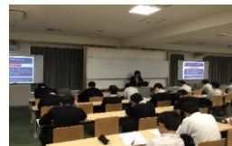
特進クラス:視聴覚教室