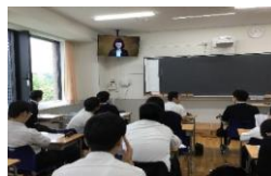
進学クラス:各教室

受験科目の勉強だけではなく、幅広い事柄に興味・関心を持ちましょう。様々な分野に関する知識を日ごろから蓄えておくことが、小論文ではとても大切です。