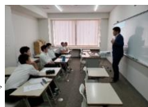
GEヘルスケア・ジャパン