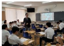
ヤマオカアンドカンパニー

エンジニア / 起業 / CMカメラマン / 国内・海外で働くこと / 開発・発明 / 情報セキュリティ / 医療 / コンサルティング / 生協 / プランニング / アナリスト / 弁護士 / 青年海外協力隊 / 研究者 / 薬剤師 / 建築士 / 市役所職員 / 社団法人鬼ごっこ