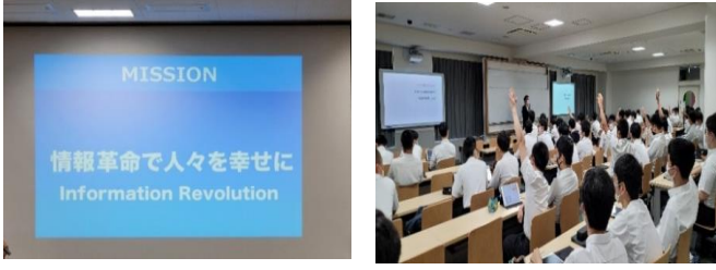
高2の生徒の皆さんは今回のセミナーを機に、自分の進路そしてその先の進路について真剣に考えてみてください。

文理の選択が固まり、今まで以上に具体的に自分の進路として将来の職業となるものを考えるきっかけとなったことだと思います。