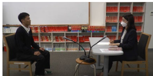
椅子の座り方や手の位置にも気を付けるポイントがあります。